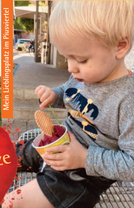
Mein Lieblingsplatz im Piusviertel