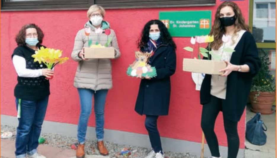
Ostergruß unseres Kindergarten für die Senioren

Auch für einen Ostergruß für Seniorenheime hatten Kinder und Team schöne Ideen. Eliana Briante