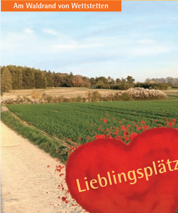
Am Waldrand von Wettsetten