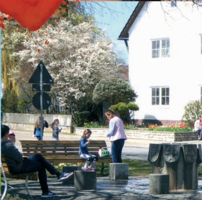
Gemeinde Stammham / Appertshofen