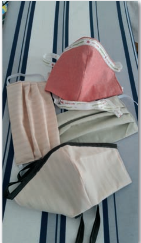
Eine Auswahl der Stoffmasken.

Spenden wurden gerne angenommen und an „Brot für die Welt“, sowie „Ärzte ohne Grenzen“ weitergeleitet.